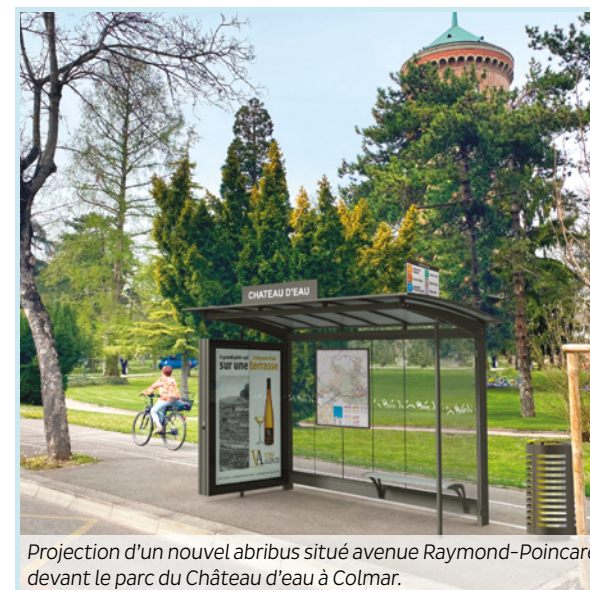
Projection d'un nouvel abribus situé avenue Raymond-Poincaré, devant le parc du Château d'eau à Colmar.

Conception : Gwendoline Bernuzzi Impression : Freppel Wintzenheim