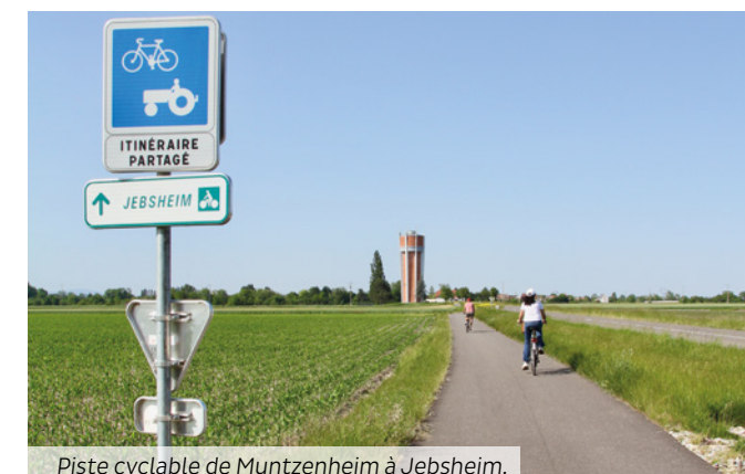
Piste cyclable de Muntzenheim à Jébsheim.