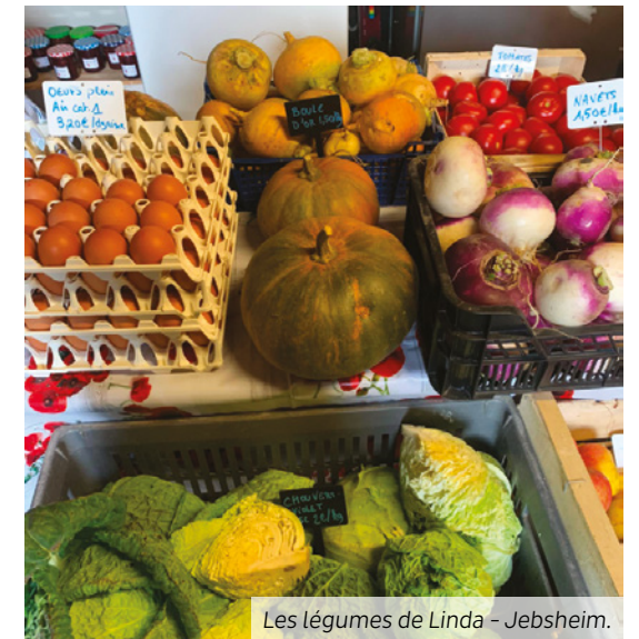
Les légumes de Linda - Jebsheim.

Dimanche 3 septembre 2023, à Jebsheim, 8h - 12h en été, 9h - 12h en hiver. +D'infos sur jebsheim.fr ou par téléphone : 03 89 71 61 40